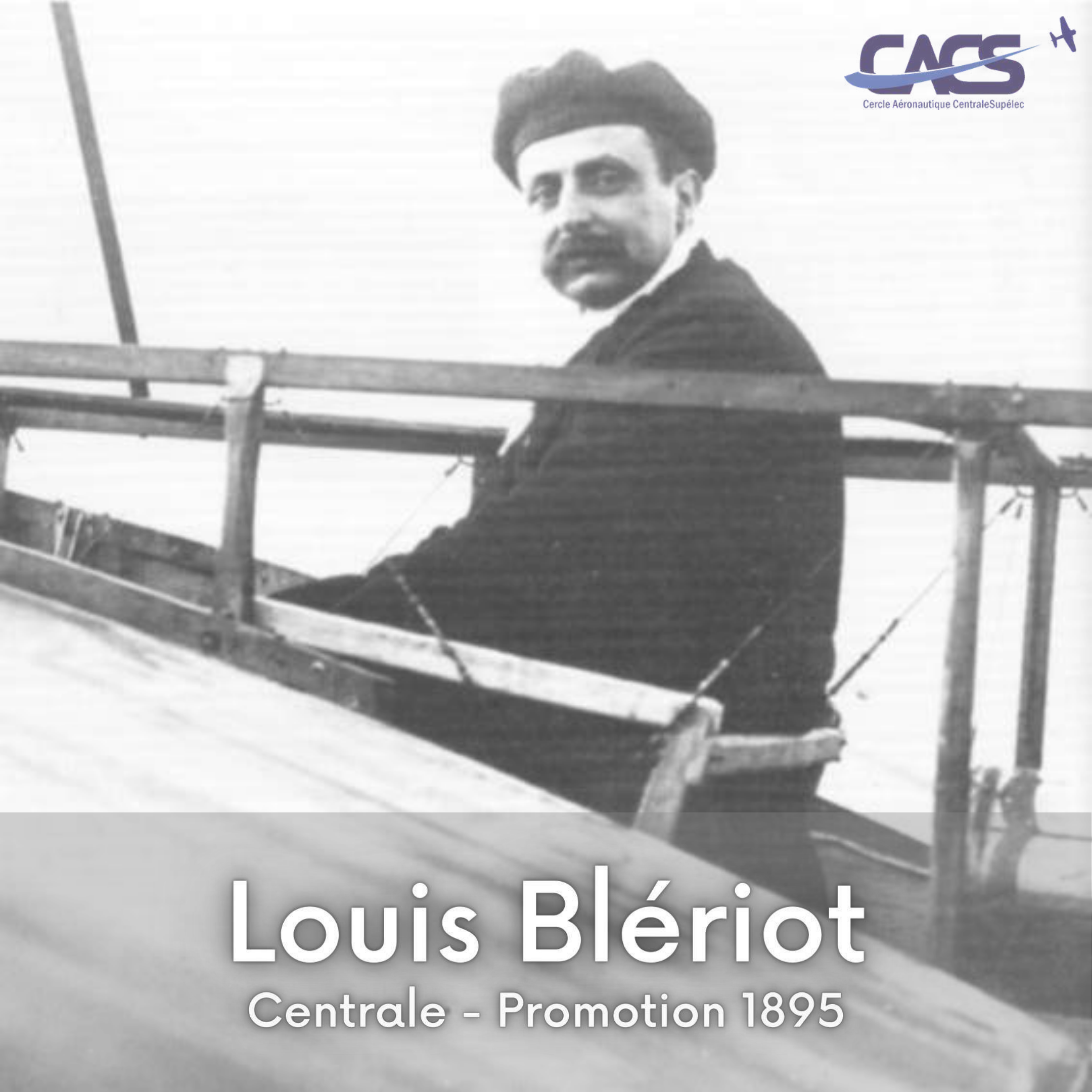
Louis Blériot Centrale - Promotion 1895